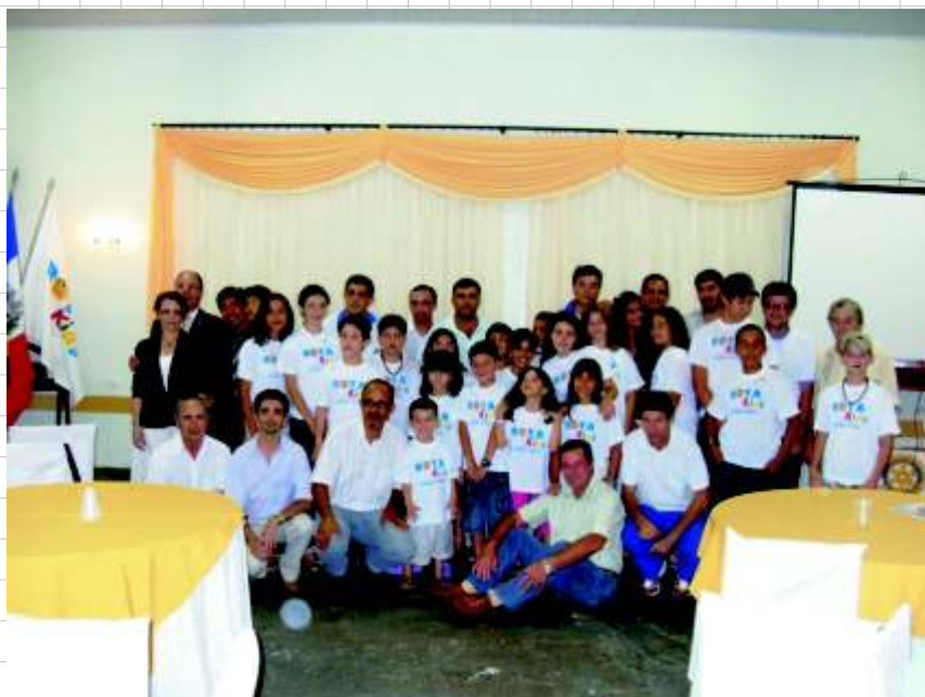
Os companheiros do RC de Califórnia e os jovens do Rotakids